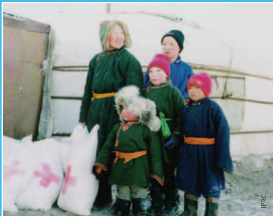
▲ Talvi voi olla julma jurttaslummeissa. Lämpötila laskee Mongoliassa ajoittain alle -50 asteeseen.

▶ Aiemmin tänä vuonna Suomen Punainen Risti lähetti Mongoliaan 15 tonnia talvi-vaatteita.