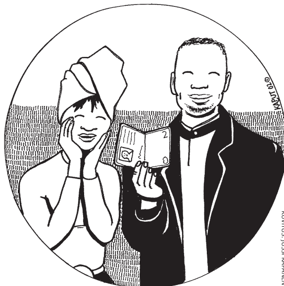
KUVITUS: JUSSI KAPKANEN

Ulkomailta toiseen maahan pysyvässä asumistaroituksessa muuttava henkilö, joka ei ole Suomen