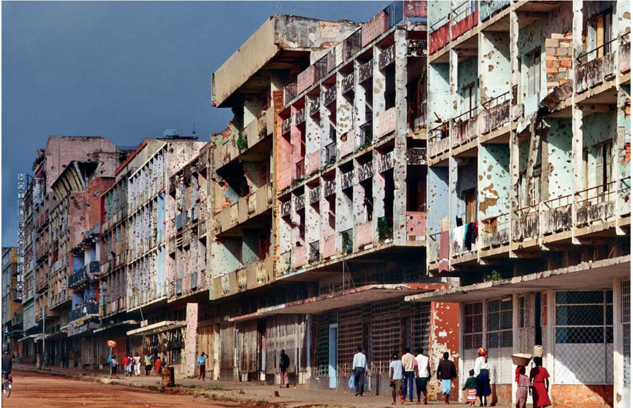
Siviiliväestöä vastaan ei saa hyökätä eikä sitä saa myöskään uhkailla väkivallalla. (LP 1 art. 51, LP 2 art. 13)