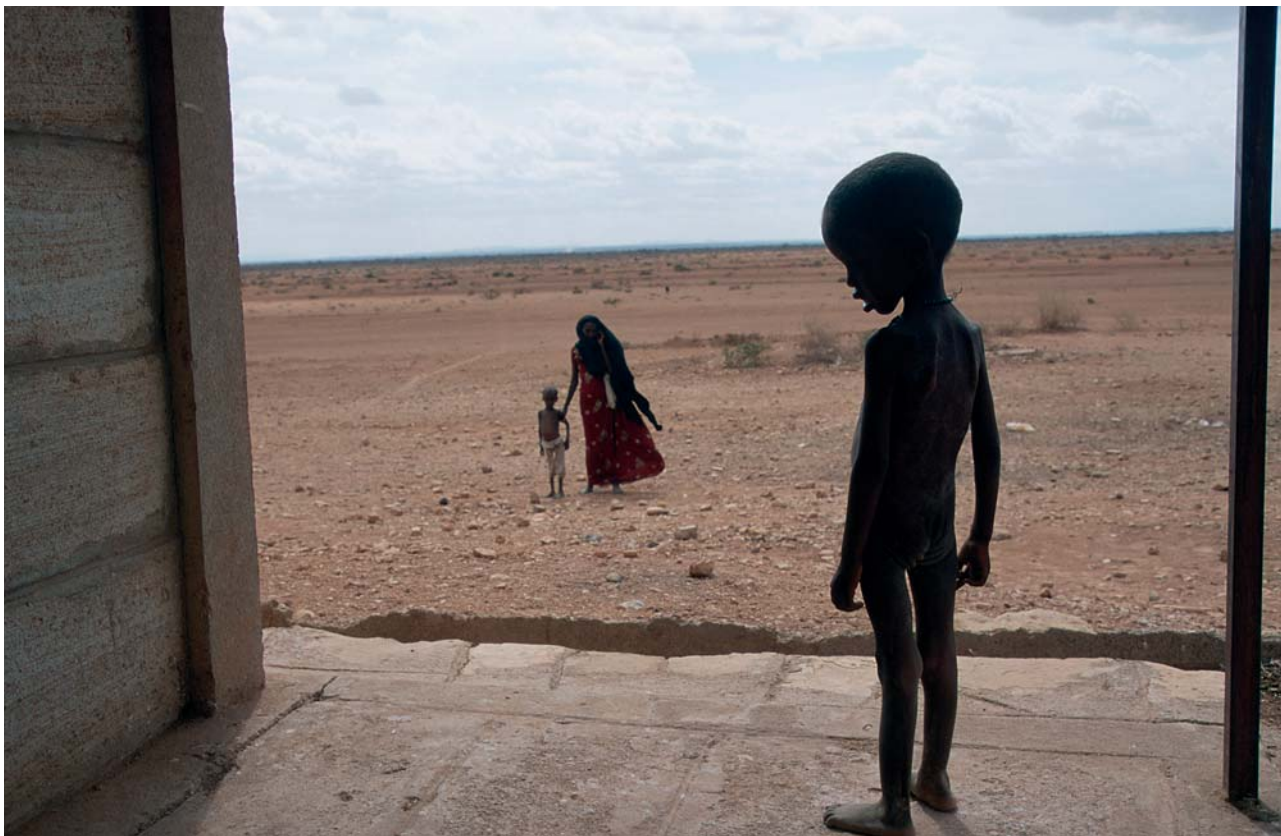
Siviiliväestölle elintärkeille kohteille – kuten elintarviketuotannolle tai vesivarjoille – ei saa aiheuttaa vahinkoa. (Ks. LP 1 art. 54, LP 2 art. 14.)