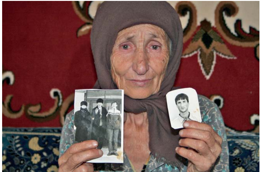
Tsetsenialaisnainen näyttää kuvaa pojastaan, joka katosi vuonna 2002 kotikylänsä mellakoissa.

Punaisen Ristin viestinvälitys auttaa perheenjäseniä pitämään yhteyttä toisiinsa, jos normaali posti- tai tietoliikenne ei sodan tai onnettomuuden vuoksi